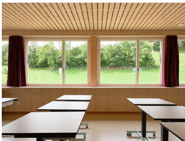
Salles de classe à l'acoustique optimisée