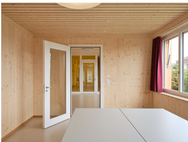
Des salles de groupe spacieuses favorisent les formes d'enseignement modernes