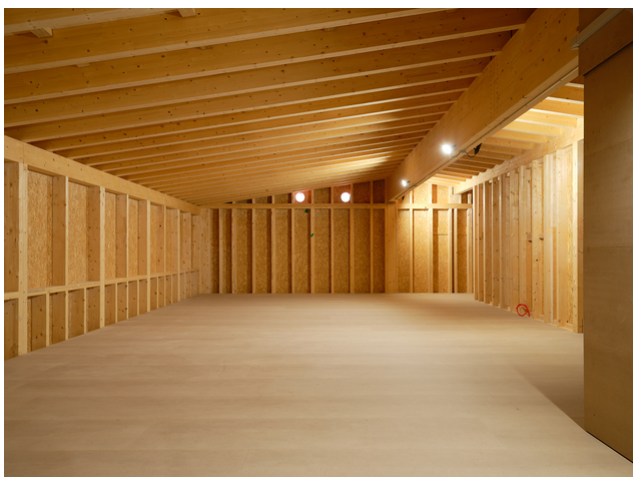
Combles pouvant être aménagés avec ouvertures de fenêtres pré-installées