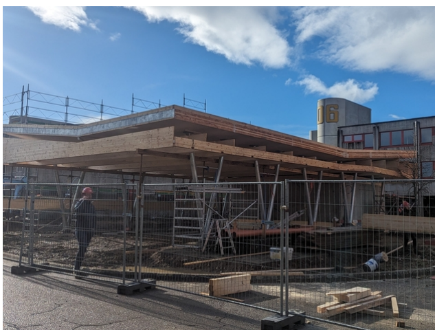
Impression du chantier