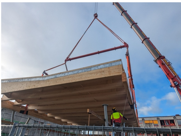
Pose des dalles collées sur la structure intermédiaire.