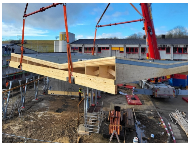
Le spectaculaire toit pliant/incliné est mis en place