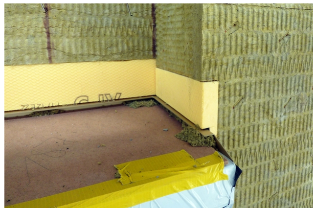
Détail de l'isolation sur le rebord de la fenêtre

La façade se caractérise par son étagement vers l'extérieur, défini en trois niveaux, et par ses fenêtres, également décalées en profondeur. L'étanchéité de la façade était aussi un grand défi à relever. Il a donc fallut réunir, étanchéifier et habiller les niveaux gradués de la façade.