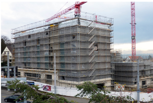
Immeuble collectif avec échafaudage de chantier

Des logements coopératifs attrayants ont été construits sur la très fréquentée Bucheggplatz, offrant plus d'espace habitable. Grâce à l'augmentation de l'indice d'utilisation et à la révision du règlement de construction, les bâtiments sont plus grands et plus hauts que les précédents. Les pièces telles que les cuisines, les salles à manger et les cages d'escalier sont tournées vers la rue. Ainsi, les chambres et les salons privés sont mieux protégés du bruit. Le plan est conçu de manière à éviter les vues frontales sur les appartements situés en face. Vers le sud, les appartements s'ouvrent sur une cour intérieure généreuse qui est protégée de manière optimale du bruit de la rue.