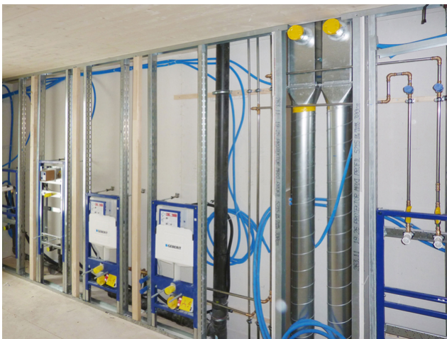
Présentation de l'installation