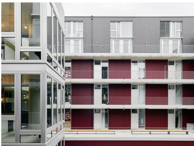
Les appartements du développement MIN MAX sont accessibles par des arcades