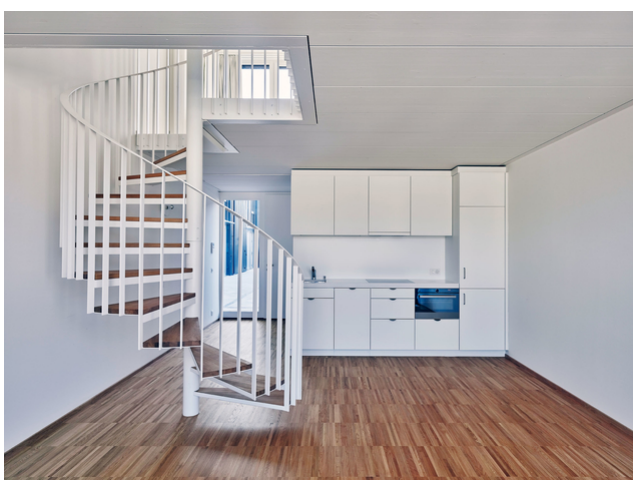
Vue d'un des appartements à deux étages de type MIN