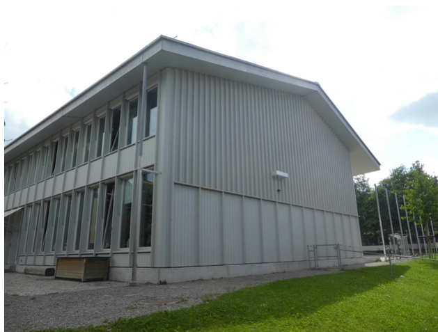
Façade vue nord