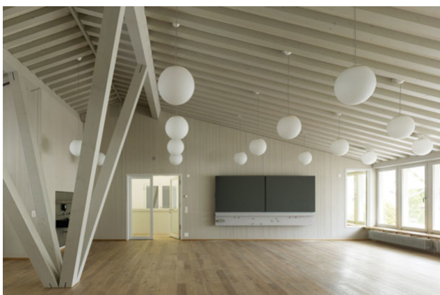
Salle de classe au rez-de-chaussée