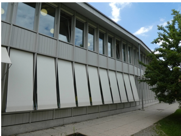
Façade vue Est