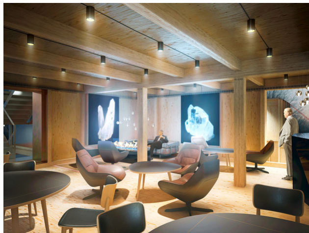
Visualisation de l'intérieur du salon