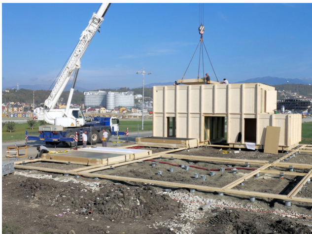
Montage à Sotchi

Les ingénieurs de Timbatec ont dû concevoir un système de construction en bois robuste, démontable et économique, qui soit stable, sûr et étanche à la pluie dans toutes les situations. La solution a été trouvée grâce à une construction à nervures, qui se répète aussi bien dans les murs que dans les planchers et le toit.