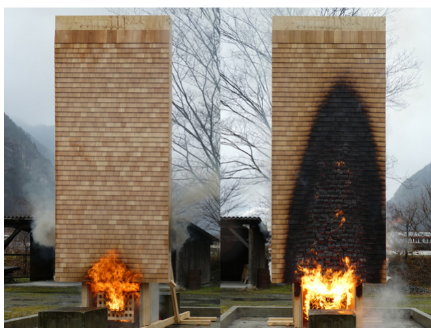
Un essai d'incendie de la façade en bardeaux