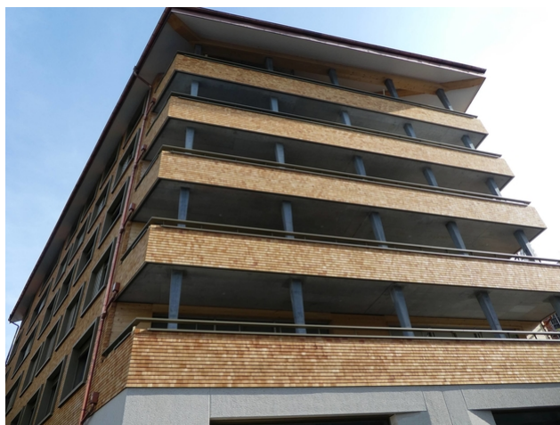
Appartementhaus Wolf : recouvert de bardeaux de bois de haut en bas