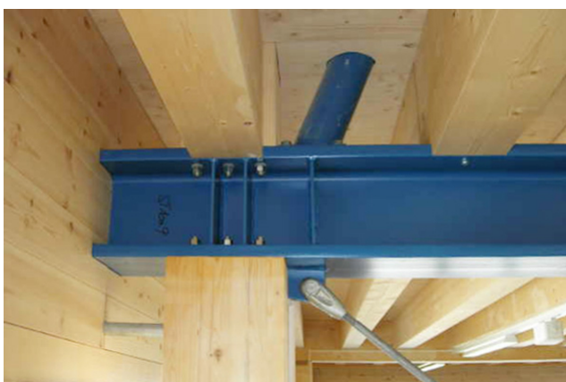
Détail avec la technologie GSA