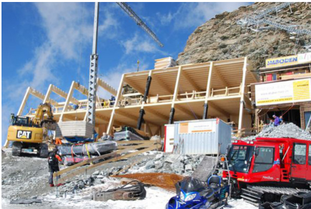
Élever le gros œuvre

Le défi était la stabilité globale, car les façades latérales / sud ne pouvaient guère contribuer au renforcement du bâtiment en raison des bandes de fenêtres continues. Les effets du vent (jusqu'à 100 m/s) et des tremblements de terre (zone IIIb) sont très élevés, ce qui a nécessité d'énormes forces d'ancrage et de renforcement. Le contreventement a été résolu par un noyau de contreventement en forme de E, composé du mur arrière du bâtiment ainsi que de trois treillis de la hauteur du bâtiment intégrés dans les murs intérieurs et placés perpendiculairement au mur arrière. Les forces de traction et de compression importantes (jusqu'à 1200 kN) provenant des poteaux des treillis sont transmises au béton par des plaques de base soudées. Ce projet a remporté le Prix Solaire Suisse 2010, catégorie B - Nouvelles constructions.