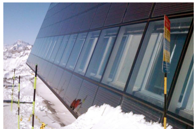
Façade avec panneaux photovoltaïques