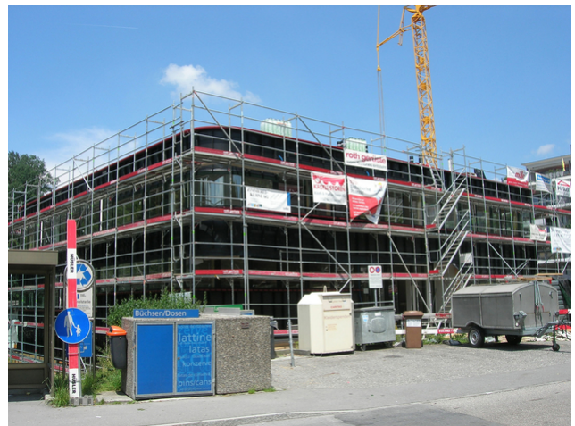
Vue extérieure depuis la Büthenbergstrasse