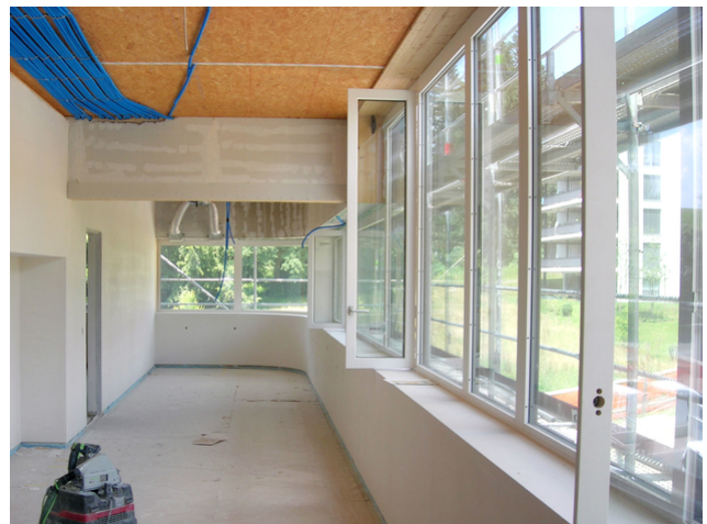
Niche de travail avec poutre BSH en saillie