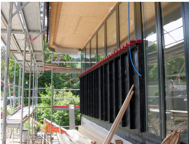
Plafond d'étage en porte-à-faux au niveau de l'accès