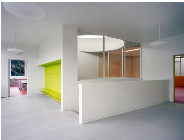
Vue intérieure ; photo : Roger Frei, Zurich

Afin de construire les grands porte-à-faux et de répartir les forces sur les fondations sur pieux, de hautes poutres en bois lamellé-collé ont été insérées dans le toit ainsi que dans les plafonds des étages. Les lanterneaux ronds ont constitué un autre point fort : grâce à l'appui filigrane en quatre points, le toit du lanterneau semble flotter sur la bande lumineuse qui l'entoure.