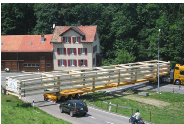
Transport de BLC: c'est étroit dans le pays d'Appenzell