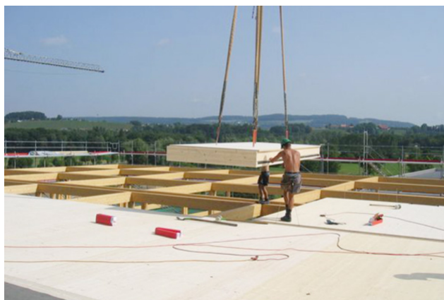
Montage d'éléments de toiture