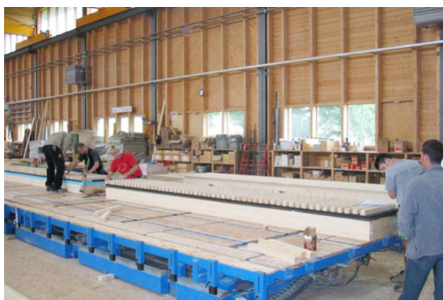
Fabrication d'éléments de toiture