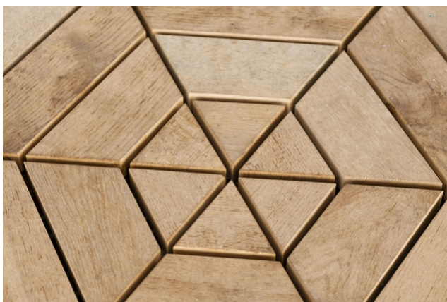
Terrasse en bois posée en hexagone