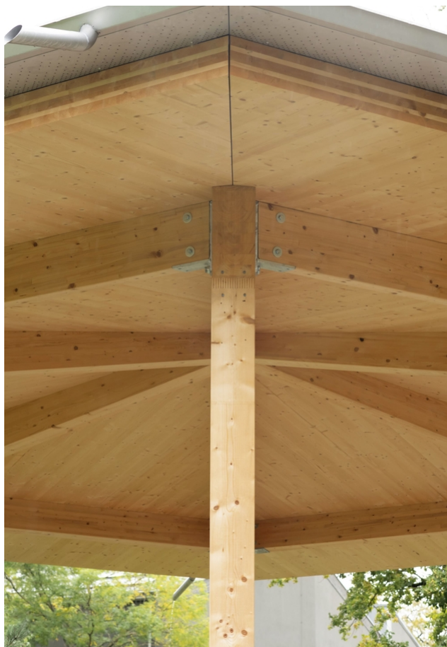
Vue sur les poteaux angulaires, raccords de poutres compris