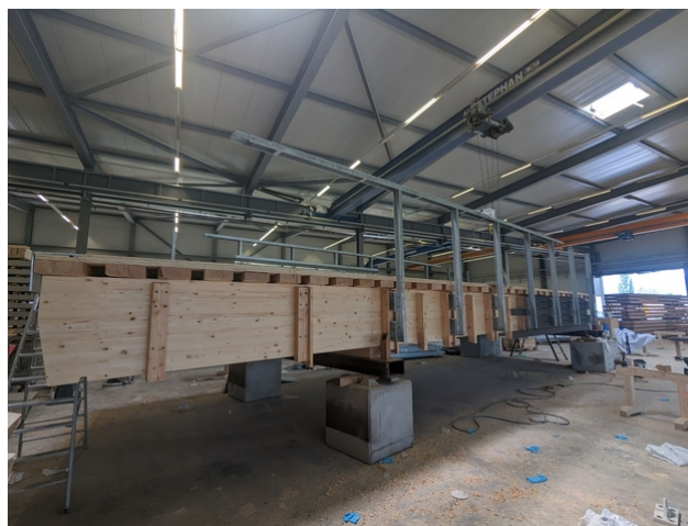
Préfabrication du pont dans les Ateliers de JPF-Ducret.