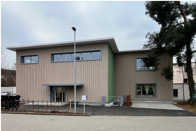
Die vertikale Fassadenverkleidung in Holz verläuft über beide Geschosse.