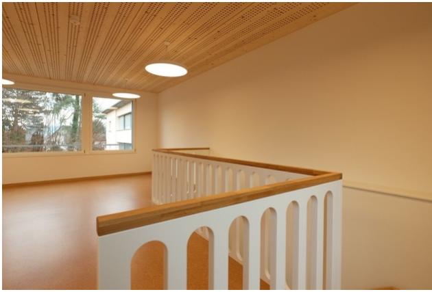
Neben Haupträumen wurden auch separate Gruppen- und Therapieräumlichkeiten geschaffen.