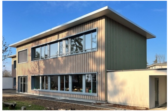
Im Zuge der Aufstockung erhielt der Kindergarten ein neues Holzkleid.