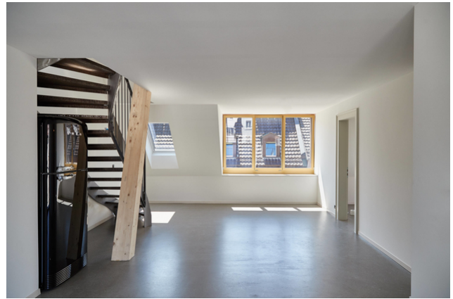
Sichtbare Strebe in der Wohnung