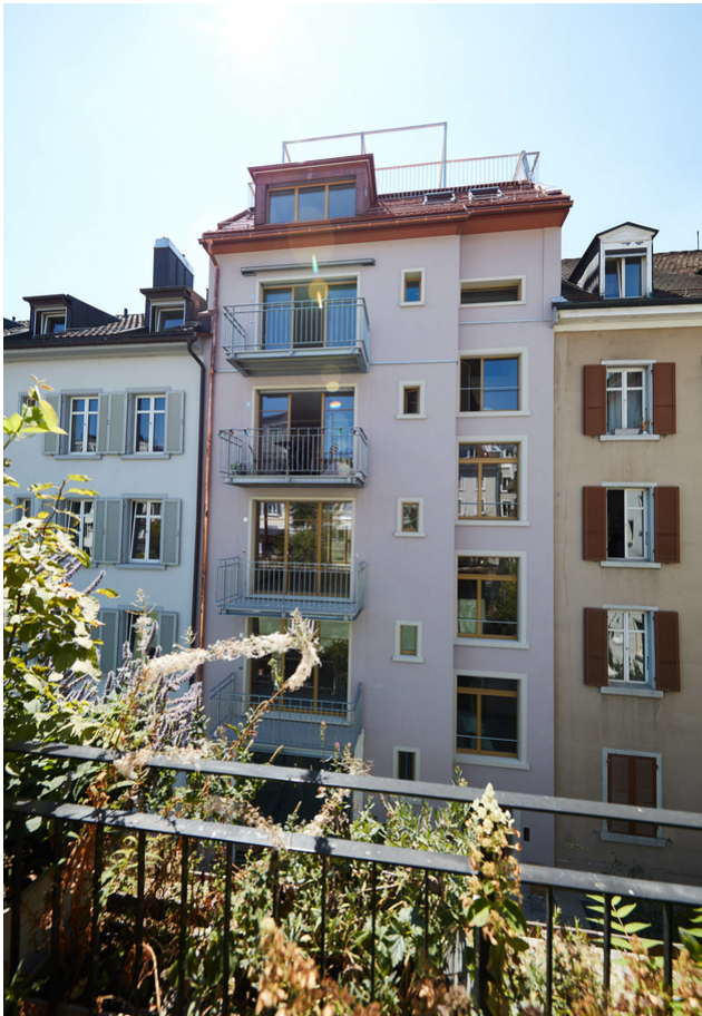
Ansicht Gebäude von aussen