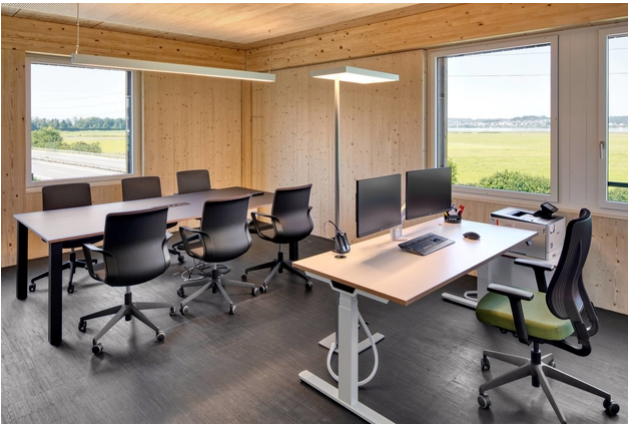
Urheber: Kost Holzbau und Gesamtbau