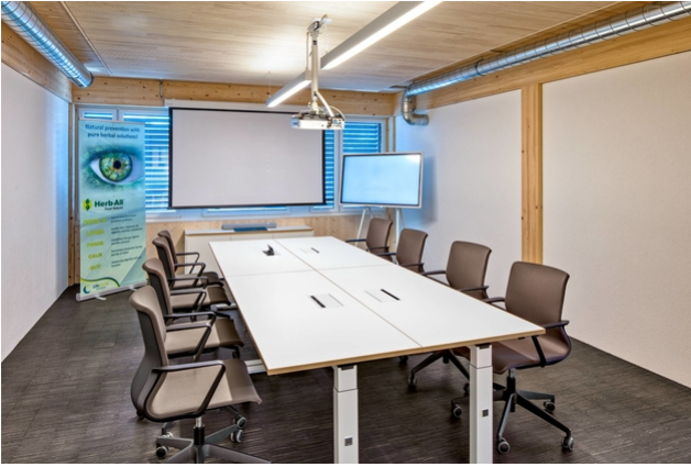
Urheber: Kost Holzbau und Gesamtbau