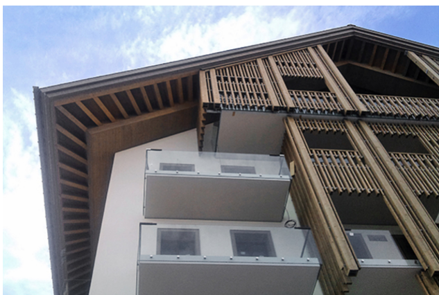
Detailansicht Kabinenhaube Ecke