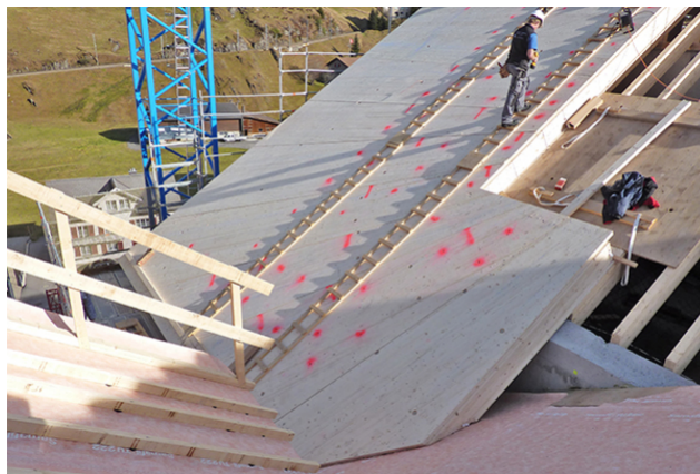
Montage von Dachelementen auf der Primärkonstruktion