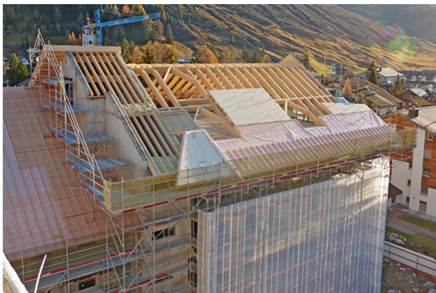
Montage von Traversen und Dachelementen Gebäude H3