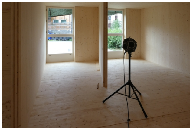
Schallmessung im Mockup