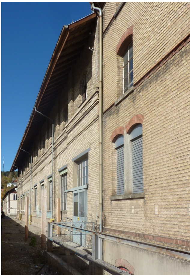
Die Fassaden sind teilweise denkmalgeschützt.