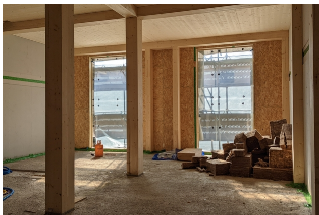
Dahinter entsteht der neue Holzbau.