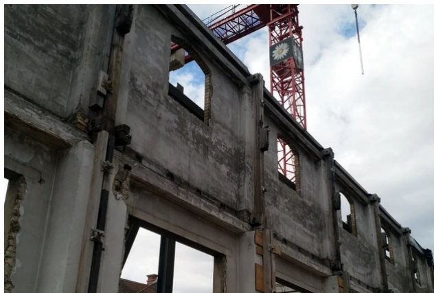
Das Gebäude wurde bis auf seine Fassade rückgebaut.