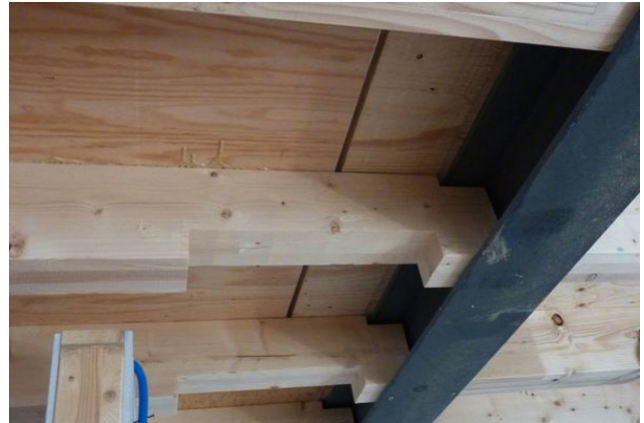
Ausschnitte für Haustechnikinstallationen in den Rippelementen der Geschossdecken