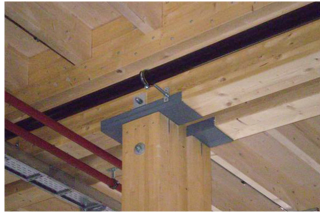
Querdruckverstärkung mit Stahl-U-Profil, Nebentragwerk auf Traglatten