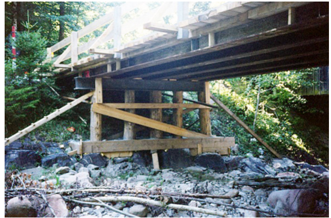
Notbrücke mit Stahlträgern